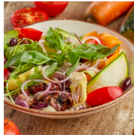
САЛАТ ОВОЩИ И РАДИЧИО

Салат радичио и руккола, маринованный артишок, морковь, цукини, оливки таджарские, свежий базилик и ..