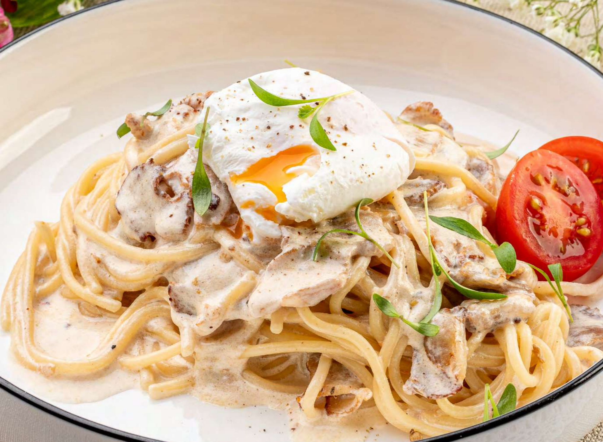
> Паста карбонара с беконом в сливочном соусе