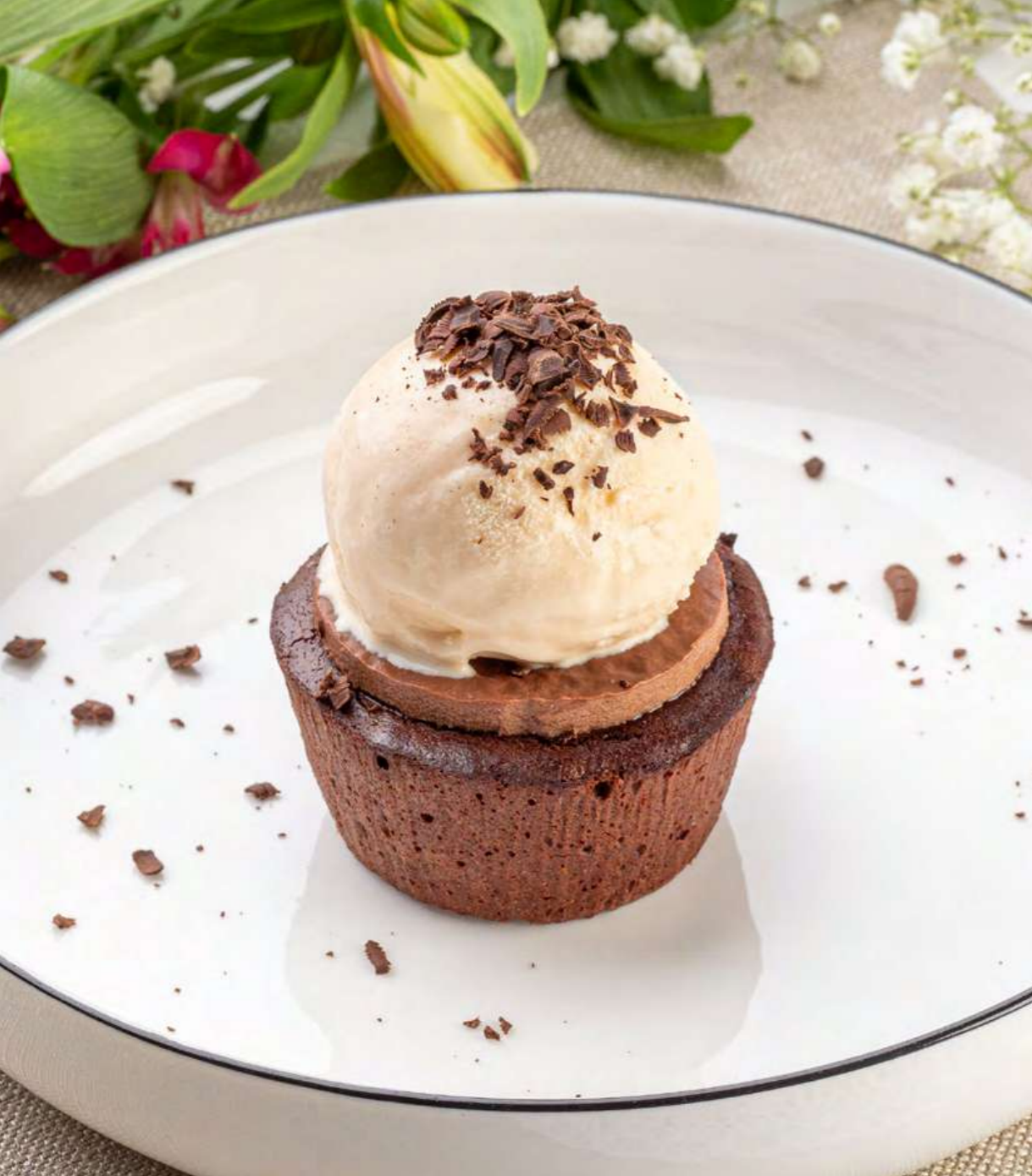
> Фондан с ванильным мороженым