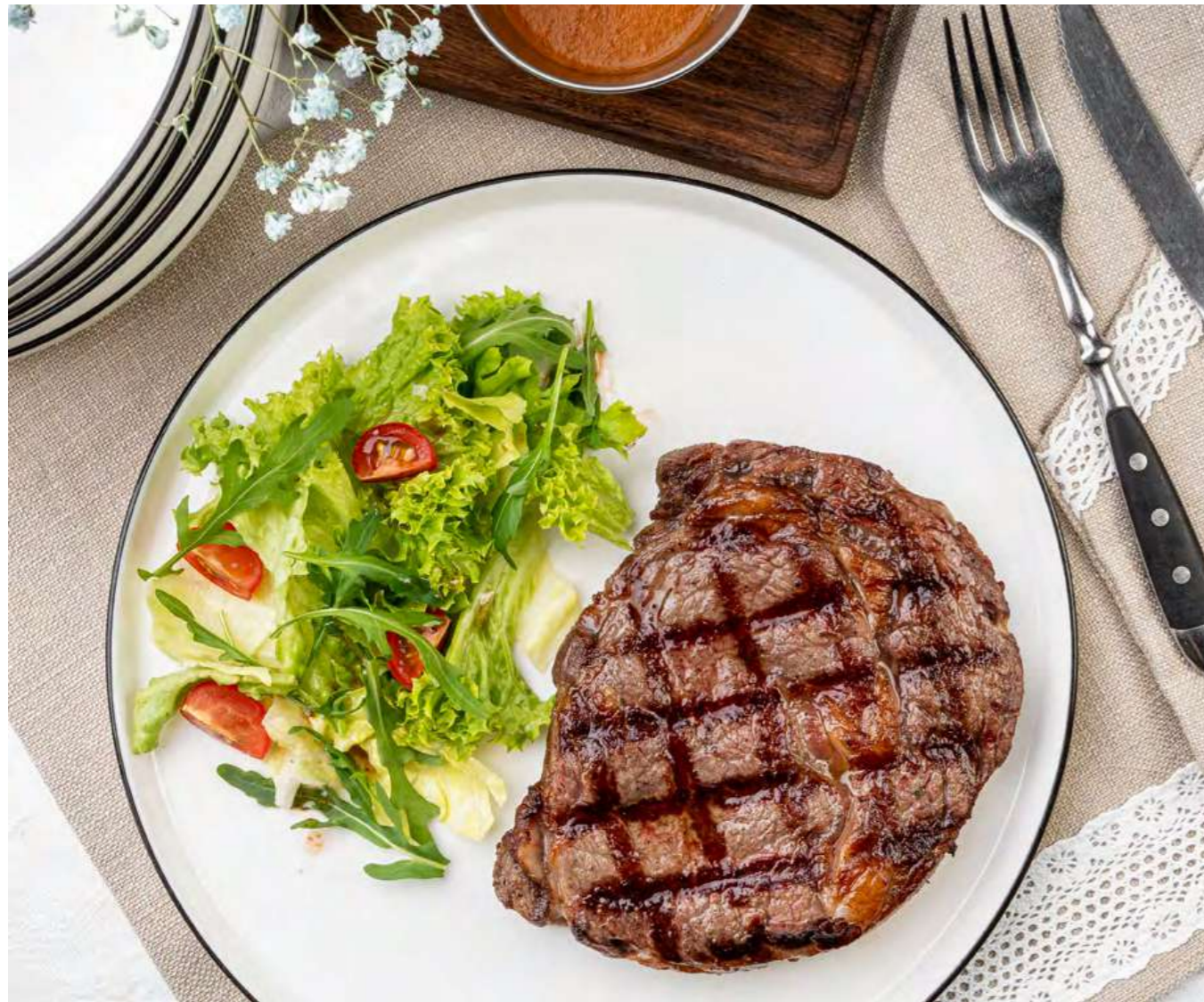
> Стейк рибай с фирменным соусом на томатной основе

Стейк рибай с фирменным соусом на томатной основе, за 100 г Ribeye steak with signature tomato-based sauce, per 100 g