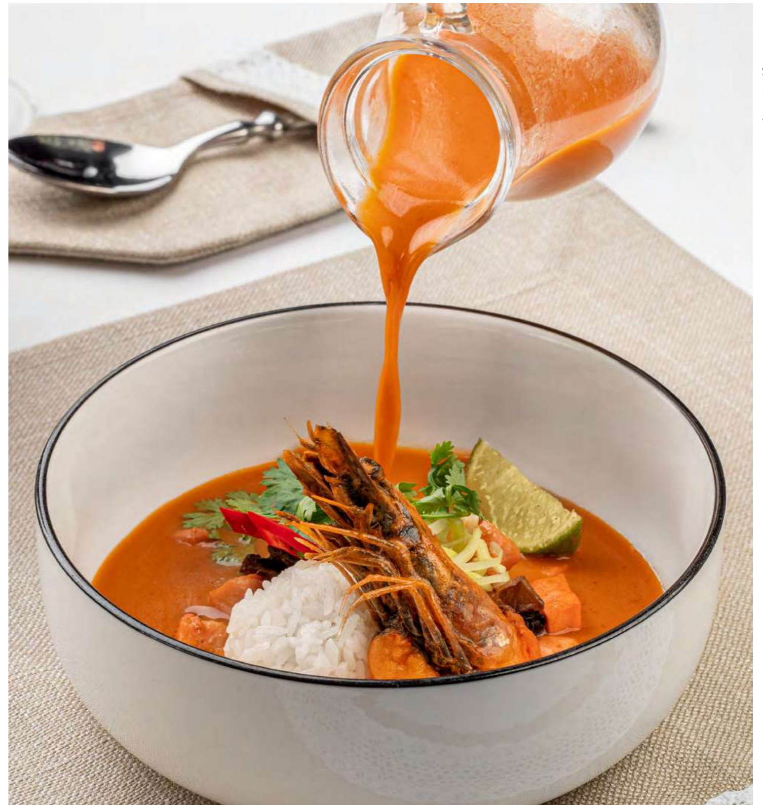
Том ям с курицей, креветками и лососем