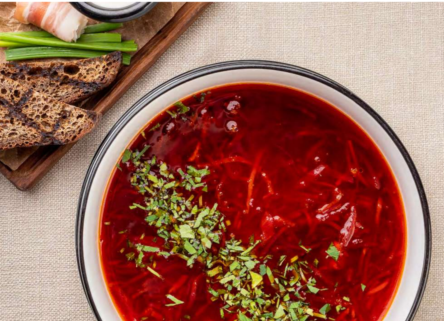
Борщ с томленной телятиной

Том ям с курицей, креветками и форелью Tom yum with chicken, prawns and trout, 300 g